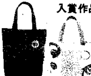
大賞（松山市社協会長賞） 道後温泉湯玉トートバック（1点）