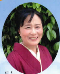
俳人 夏井 いつき 氏