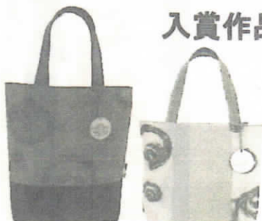
大賞（松山市社協会長賞） 道後温泉湯玉トートバック（1点）