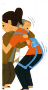
器(装着型) て介助者のアシスト