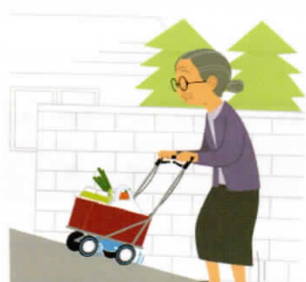
移動支援機器(屋外型) 高齢者等の外出をサポートし、荷物等を安全に運搬できるロボット技術を用いた歩行支援機器