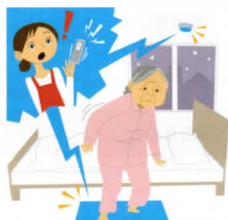
見守り支援機器(介護施設型) センサーや外部通信機器を備えたロボット技術を用いた機器及びプラットフォーム